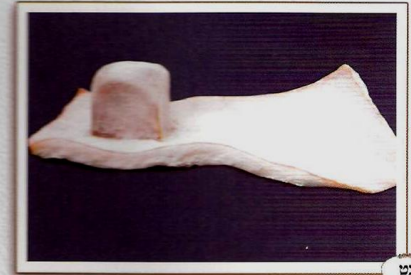
תפילין של יד הצד הפנימי